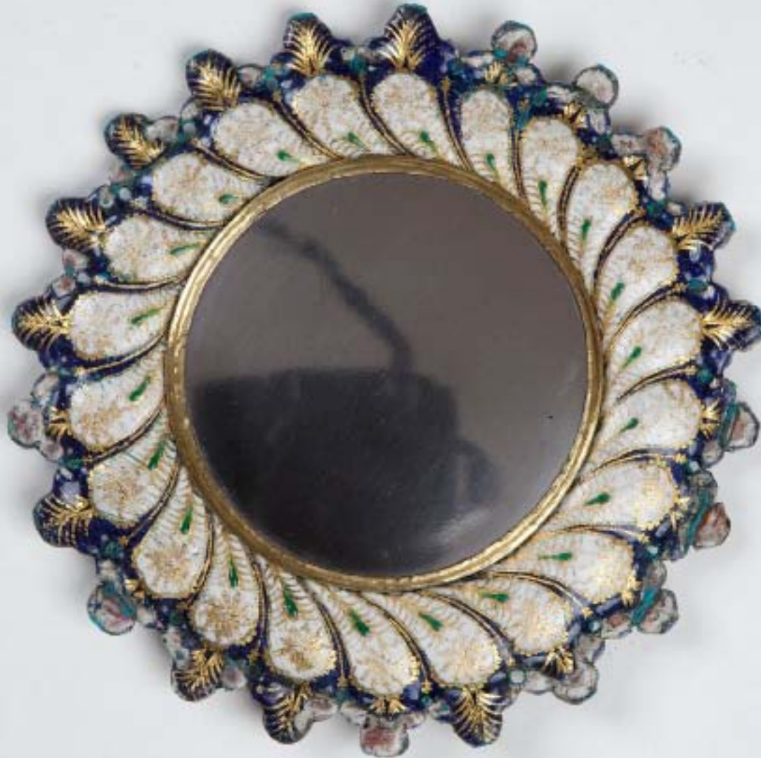
Specchio, fine del XV secolo. Venezia, Galleria di Palazzo Cini.