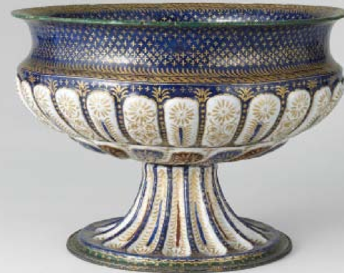
IN COPERTINA Piatto, fine del XV o inizio del XVI secolo. Venezia, Galleria di Palazzo Cini.