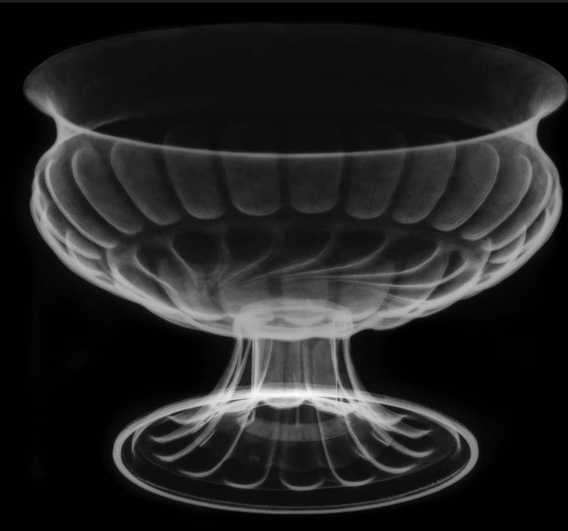
Coppa, inizio del XVI secolo, radiografia. Parigi, Musée du Louvre © C2RMF / Anne Maigret.